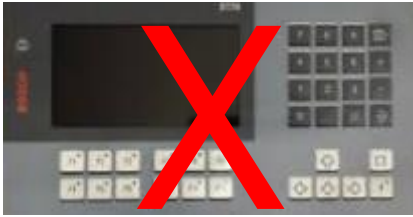
BT20 – TsDOS, TsWin