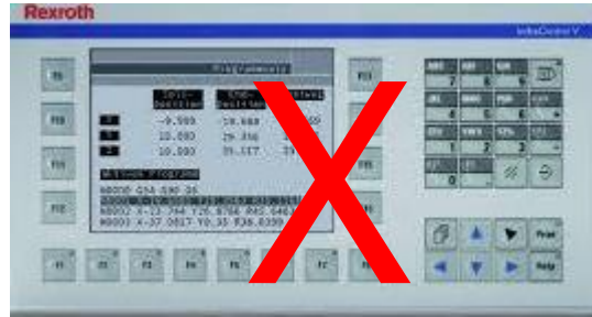
VCP20 – VI Composer