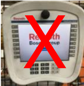
VEH30 – Windows CE