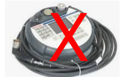
VEH08 – VI Composer