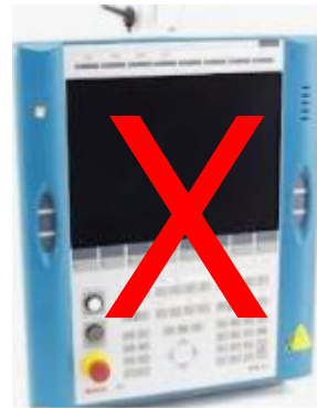
CPS21 - OpCon