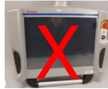
VPP21 – no BR Software part